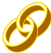
Tot op heden gaven 12 koppels elkaar het ja-woord in de molen

Ook de nieuwe gemeente Pijnacker-Nootdorp heeft de molen aangewezen als 'huis' waar huwelijken mogen worden gesloten. Het bestuur van de stichting heeft voorwaarden en regels opgesteld, zodat belangstellenden vooraf weten waar zij aan toe