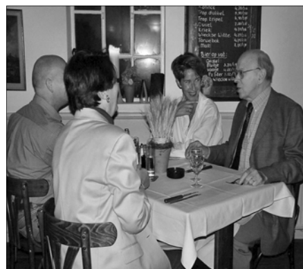
als dank voor hun inzet werden de vrijwilligers door de