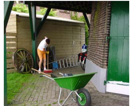
ook het tuintje en het terrein vragen om onderhoud

We willen in deze Molenpraat wat nader ingaan op dit vrijwilligerswerk,