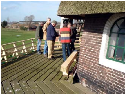
de eerste groep belangstellenden