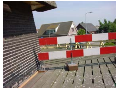
veilig bij draaiende molen