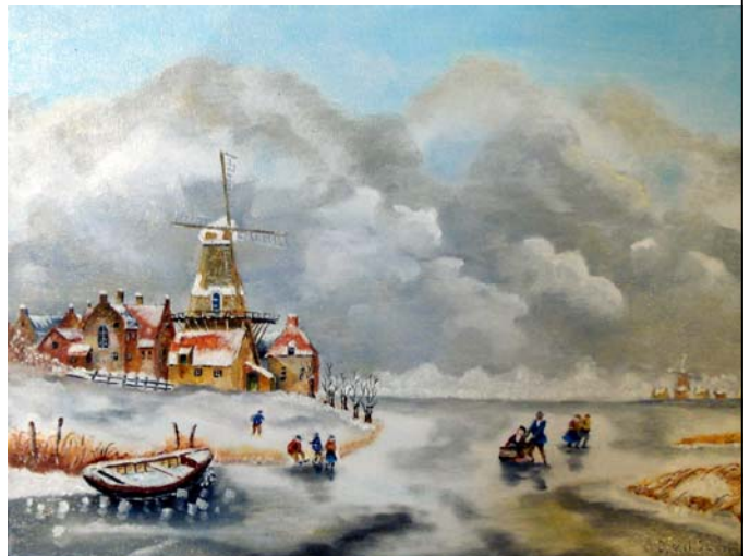
één van de schilderijen van Jan van der Sman

Het weekeinde van 22 en 23 september toonde Jan van der Sman in de molen zijn tekeningen en schilderijen met molens. Op beide dagen wisten vele belangstellenden de weg naar de molen te vinden, in totaal wel meer dan 500.