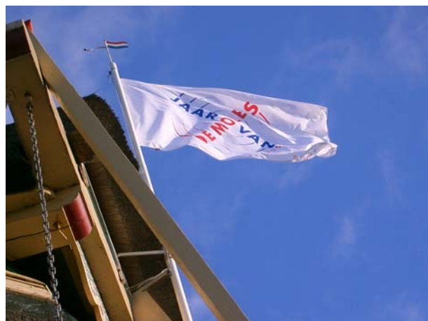
Het hele jaar heeft de JvdM-vlag in top gestaan. We versleten daarbij 2 vlaggen.

Aan het eind van het jaar stelde de BankGiro-Loterij een bedrag van 500.000 euro ter beschikking, te verdelen over de deelnemende organisaties. Het ziet ernaar uit dat ook wij met een bedrag van ca. 1000 euro voor onze deelname worden beloond. We wachten af.