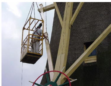
schilders aan het werk in 2000

Rabobank, nogmaals hartelijk dank! We kunnen voorlopig weer vooruit.