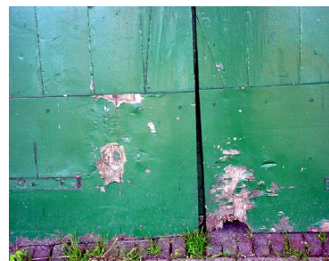
dit beeld spreekt voor zichzelf