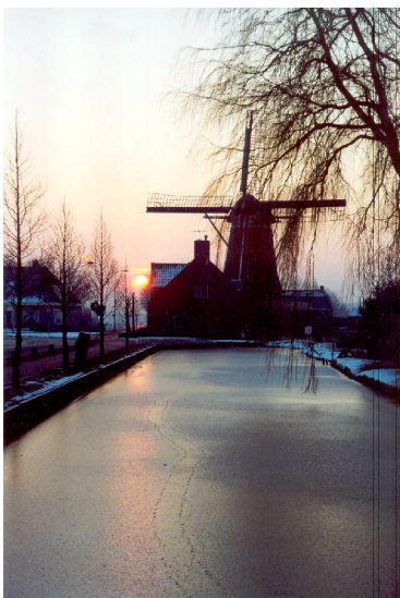
1e prijs Marcel Blokland