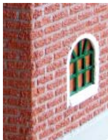
detail van het metselwerk

De rietimitatie is gemaakt van twee kleuren aquariumzand. Eerst zijn 2 lagen lijm aangebracht en daarop twee lagen beige verf. Het zand is met een fijne zeef gestrooid in de nog natte 'lobbige' (= dikke, nog natte) tweede verflaag.